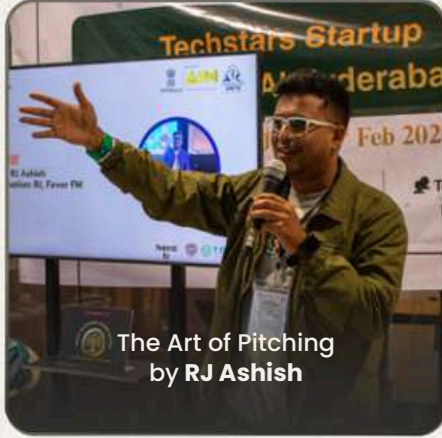
The Art of Pitching by RJ Ashish